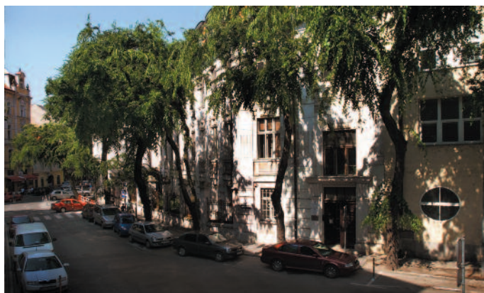
Palackého 1 810 00 Bratislava