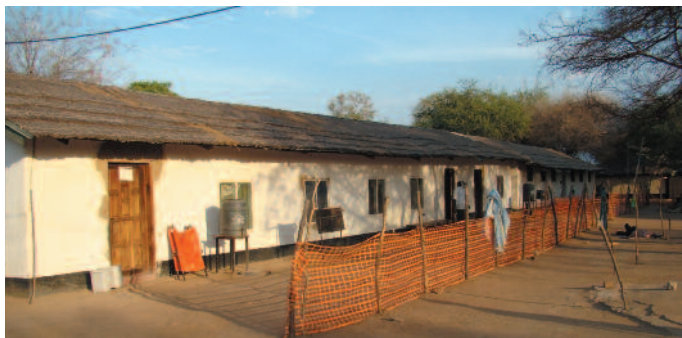
Nemocnica Marialou, Sudán