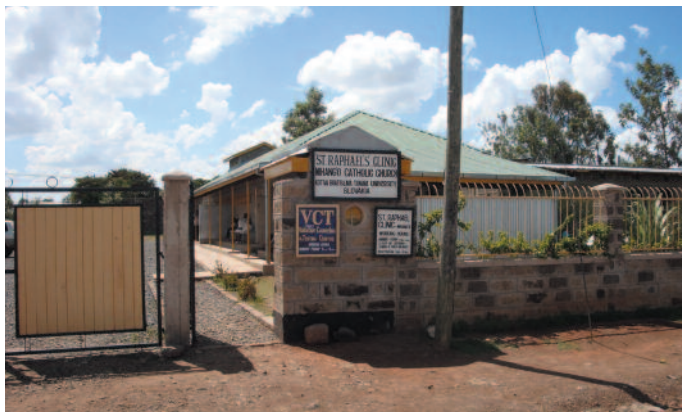
Klinika pre chudobných svätého Rafaela, a svätej Bakithy, Mihango, Keňa