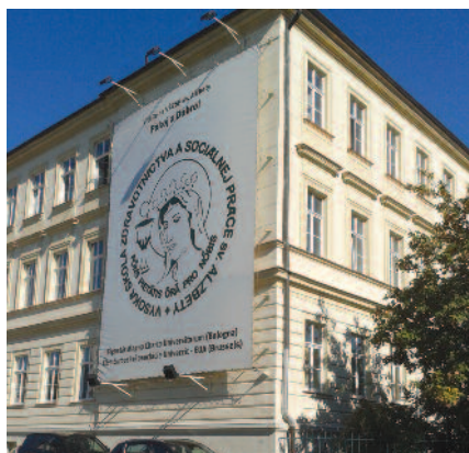
Námestie 1. mája 1 810 00 Bratislava