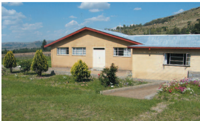
Klinika Maqhaka, Lesotho