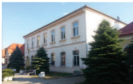
Vzdelávacie a rozvojové stredisko Blahoslavenej Matky Terezy, IVSP pri VŠSA, Dolná Krupá