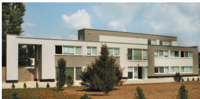
Polianky 6205-4/A, 841 01 Bratislava