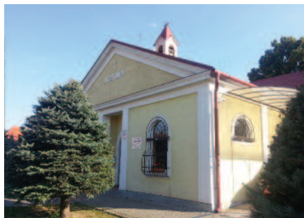
Univerzitné azylové centrum pre rodiny Jozefínium Dolná Krupá 293