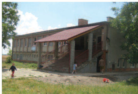
Univerzitné sociálne centrum svätého Don Bosca, Čífer a blahoslaveného Títusa Zemana, Jamá 322