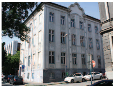
Univerzitné kolégium Bl. Zdenky Šelingovej a Univerzitné pastoračné centrum Bratislava Leškova 6, Bratislava